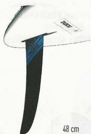
48 cm Freeride Tabou / Power Box